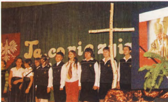
Święto Niepodległości w SP