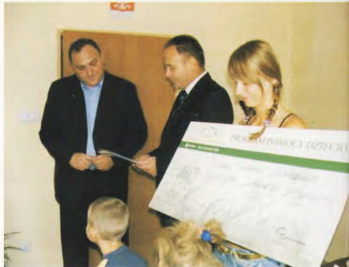
Starosta i dyrektor Banku WBK mogą myśleć o kolejnych prezentach