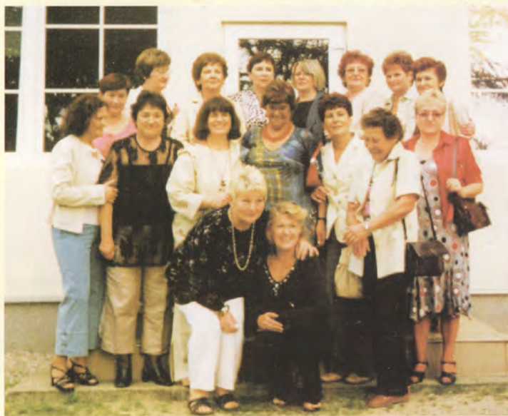
Uczestniczki spotkania Rewal 2007 r.