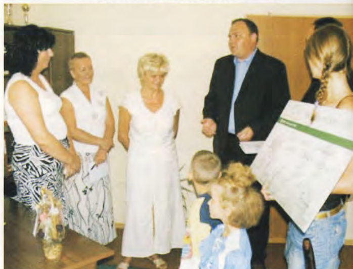
Z prezentu zadowolone były dzieci oraz ich nauczyciele