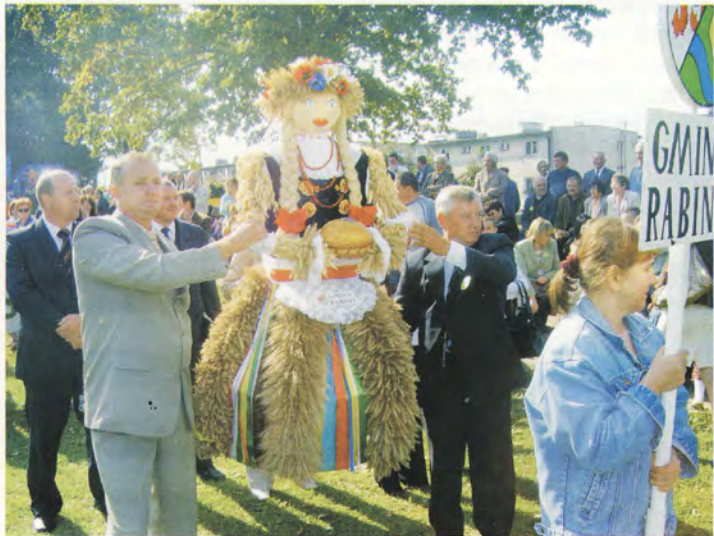
Barwny korowód dożynkowy

Prezentowały się gminy: Brzeżno, Rąbino, Sławoborze, a także Świdwin i Połczyn Zdrój ze swoimi stoiskami promocyjnymi. Organizatorzy zadbali o wiele atrakcji, konkursów, gier, występów dla dzieci i dorosłych. Jak zawsze dużym powodzeniem cieszyła się wojskowa grochówka, chleb ze smalcem i ogórkiem. Pogoda dopisała, humor także.