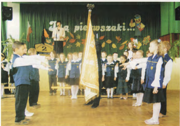
Pierwszaki ślubowały z dużym przejęciem