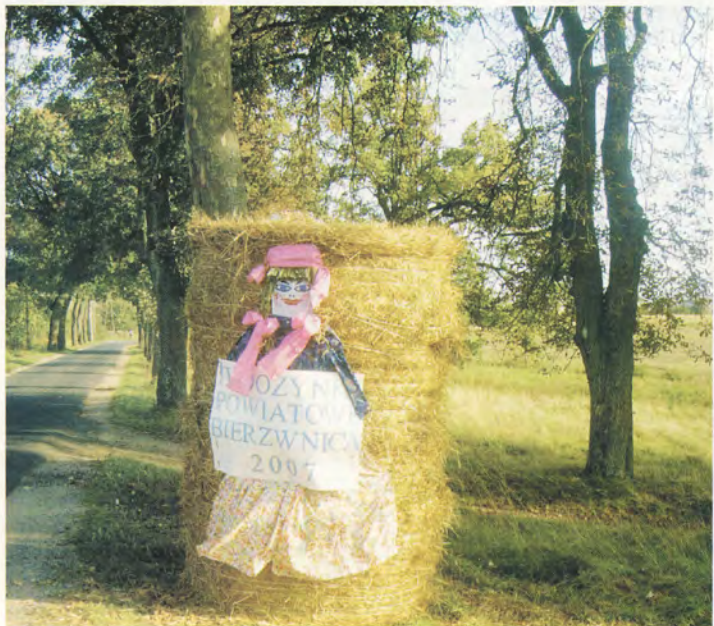
Już na rogatkach Bierzwnicy witano uczestników dożynek powiatowych