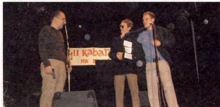
Kabaret Czesuaf z Poznania

Z uwagi na wspomnianą wyżej tematykę 5 grudnia 2006 r. odbyła się międzynarodowa konferencja zorganizowana przez Polskie Towarzystwo Nauk Politycznych oraz Katedrę Systemów Politycznych Uniwersytetu Łódzkiego pod patronatem Zarządu Głównego PTNP.