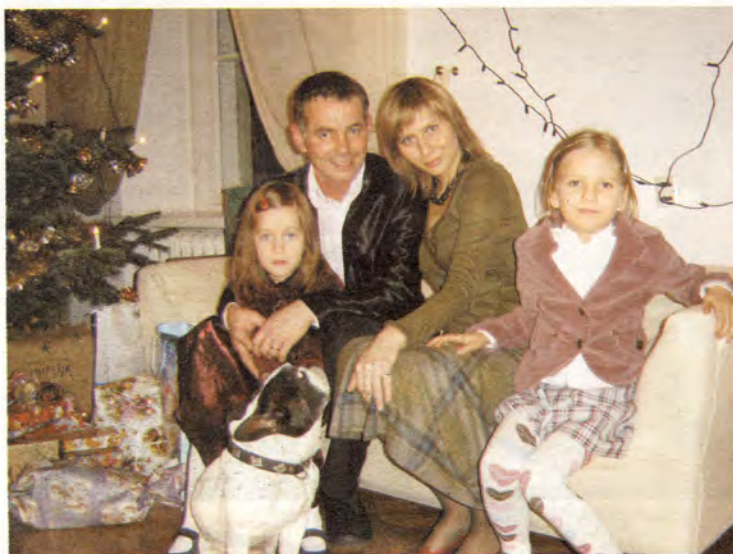
Robert Janowski w rodzinnym gronie