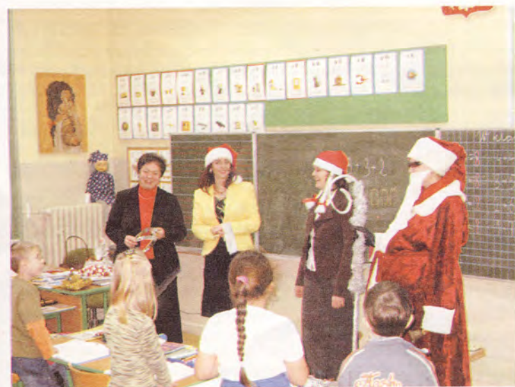
Klasę I b odwiedził Święty Mikołaj i wysłuchał piosenki o sobie