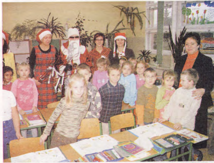
Uczniowie klasy w towarzystwie Mikołaja