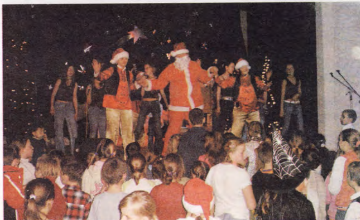
I wreszcie pojawił się długo oczekiwany Święty Mikołaj