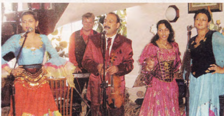
Cygańską muzyką zabawiał gości zespół „ Rewia ”