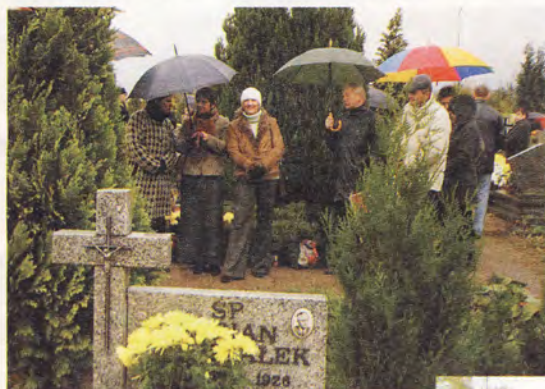
Dwa pokolenia rodziny Rybackich zgromadziły się przy rodzinnym grobowcu