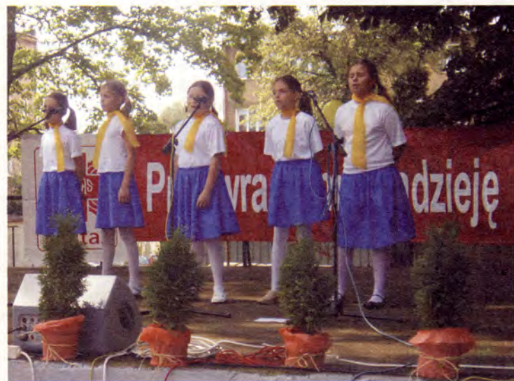
Duże zainteresowanie wzbudził koncert zespołu „Barka” z Krosina

Caritas istnieje od 22 sierpnia 1996 r. W swej działalności kieruje się Instrukcją Konferencji Episkopatu Polski „O pracy charytatywnej w parafiach” oraz Statutem Diecezji Koszalińsko-Kołobrzeskiej. Celem głównym przyświecającym Świdwińskiej Caritas jest realizowanie zadań miłosierdzia wobec każdego człowieka, ze szczególnym uwzględnieniem potrzeb dzieci.