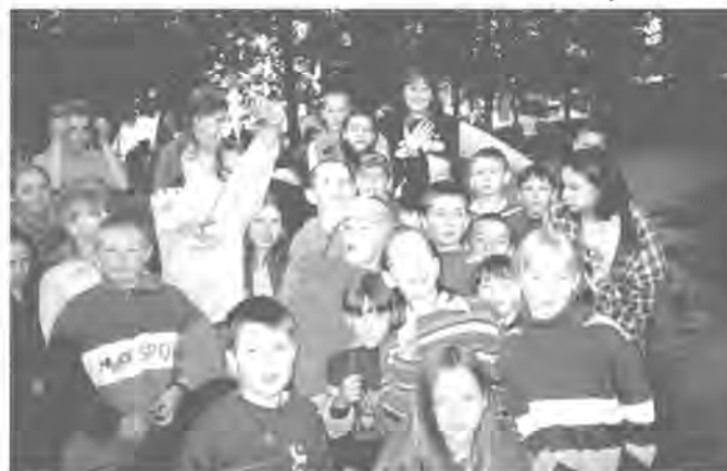
Tak dzieci okazały swoją radość na placu zabaw przy ulicy Wojska Polskiego 31. 05. 2000 roku