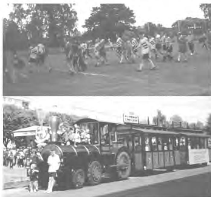
Po ulicach miasta ku radości milusińskich jeździła kolejka „Pacyfik”.