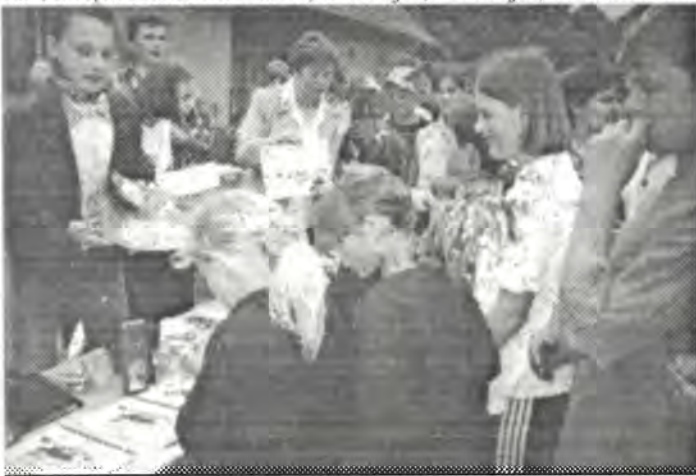
Uczniowie podczas loterii fantowej

Na pewno bardzo szybko. Wiele się też wydarzyło. Odbywały się różne uroczystości i apele, m.in. „Święto pieczonego ziemniaka”, święta okolicznościowe, andrzejki, mikołajki, bal karnawałowy