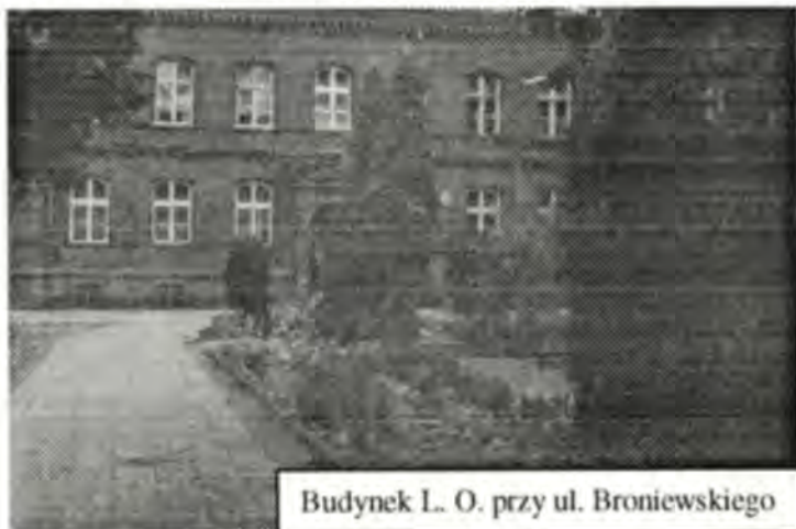
Budynek L. O. przy ul. Broniewskiego