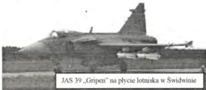
JAS 39 „Gripen” na płycie lotniska w Świdwinie

W drugim dniu ćwiczeń realizowano szkolenie w lądowaniu