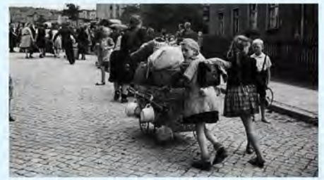
W drodze do transportu