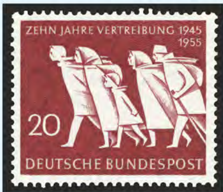
Znaczek upamiętniający tragedię wysiedlenia