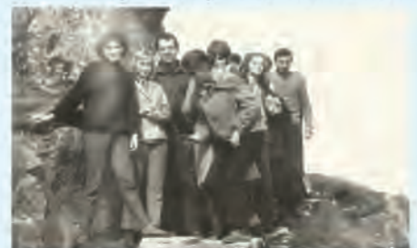
Zawsze z młodzieżą

cącym im. Stanisława Staszica w Polczynie-Zdroju. Pracował tam nieprzerwanie przez 25 lat. Początkowo jako nauczyciel, a od 1976 roku jako dyrektor szkoły, która za jego kadencji została przekształcona w Zespół Szkół. Jako jedna z pierwszych w kraju przystąpiła do programu szkół stowarzyszonych UNESCO (wyróżniona przez dyrektora generalnego UNESCO dyplomem i medalem pamiątkowym). Zdolności organizacyjne umożliwiły mu dokonanie wielu usprawnień. Rozbudował i zmodernizował gmach i otoczenie szkoły (nowe pracownie naukowe i boiska sportowe). W ramach remontu kapitalnego wybudował wręcz od podstaw internat i nową stołówkę. W 1983 roku przeniósł się do Opola, gdzie pełnił obowiązki dyrektora III Liceum Ogólnokształcącego im. Marii Skłodowskiej-Curie, aż do momentu przejścia na emeryturę. W Polczynie-Zdroju uczył matematyki, fizyki, astronomii, języka angielskiego i niemieckiego, a nawet przysposobienia obronnego. Jego pasją była praca z młodzieżą. Na lekcjach oraz w szeroko rozumianych gremiach i formach zajęć pozalekcyjnych. Swoje talenty i zamiłowania ar-