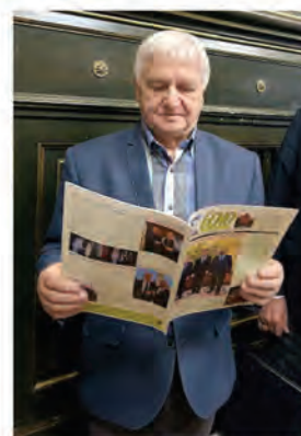
gen. Zygmunt Politowski , Toruń