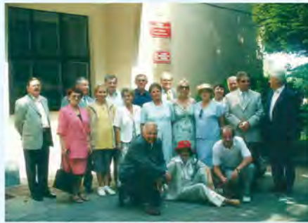
Zjazd Absolwentów w LO Połczyn-Zdrój (2002)