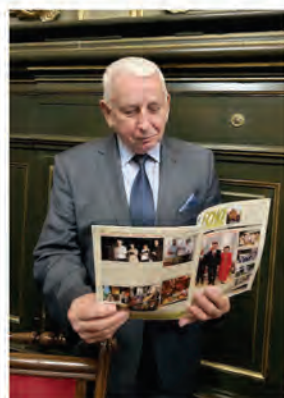
gen. Andrzej Piotrowski , Toruń