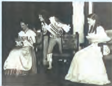
Aktor na studiach

Ogólnokształcącym im. Jana Kasprowicza w Inowrocławiu. Następnie, zgodnie z otrzymanym nakazem pracy, podjął etatową pracę w szkole Podstawowej nr 1 w Aleksandrowie Kujawskim. Wkrótce też awansował. Wpierw na nauczyciela metodyka wychowania fizycznego, a następnie w tamtejszym Wydziale Oświaty Prezydium Państwowej Rady Narodowej przejął obowiązki kierownika referatu wychowania fizycznego i higieny szkolnej. Powodowany wewnętrznym nakazem dalszego kształcenia oraz faktem, że czuł się z gruntu humanistą, zapragnął po dwóch latach dołączyć do swego przyjaciela na wyższej uczelni, by zostać historykiem. I znowu rada rodzinna orzekła, że „w Polsce Ludowej historia jest nauką zbyt służebną wobec linii politycznej partii”. Obrął więc apolityczny kierunek studiów: matematykę. Uzyskał w Ministerstwie Oświaty i Wychowania pisemną zgodę na odroczenie nakazu pracy na okres trwania studiów stacjonarnych. W 1958 roku ukończył w Wyższej Szkole Pedagogicznej w Gdańsku studia magisterskie na kierunku matematyka. Jego zainteresowania teatralne, przejawiane już w szkole powszechnej, znalazły w Gdańsku możliwość samorealizacji i rozwoju. Uczestnicząc w 1955 roku wraz z zespołem arty-