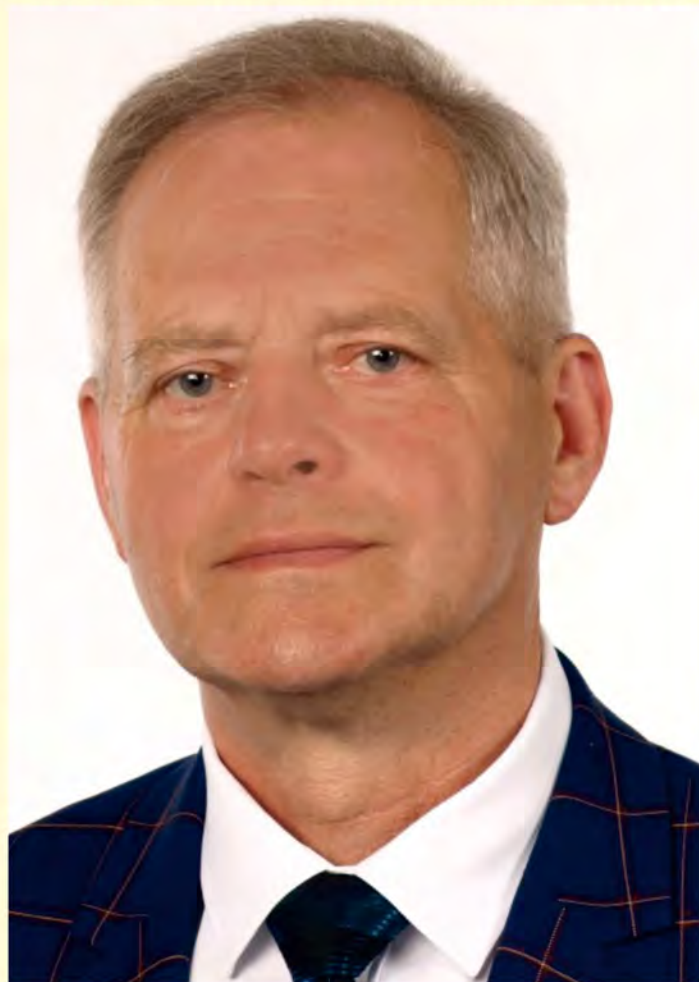
Józef Nizioł, burmistrz Połczyna-Zdroju