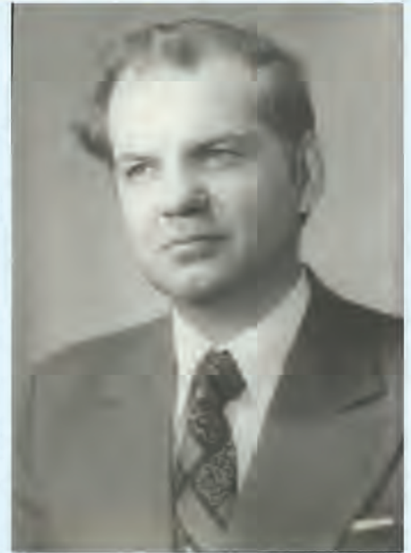
Dyrektor LO w Polczynie Zdroju