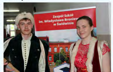
Informacje zebrała: Katarzyna Felińska

w szachy. Na pamiątkę spotkania uczniowie mieli możliwość zrobić zdjęcie na ławeczce absolwenta. Uczniowie klas I i II przygotowali na ten dzień prawdziwą kulinarną ucztę promującą zdrowy styl życia. Na kolorowych stołach pojawiły się przekąski z warzyw i owoców dla wszystkich gości. Miłośnicy kawy i herbaty mogli obserwować piknik ze szkolnej kawiarenki. A jeśli komuś zabrakło sił, posilał się grochówką. Ósmoklasiści tego dnia lepiej poznali szkołę, jej nauczycieli, uczniów, ale przede wszystkim uzyskali informacje dotyczące profili proponowanych w liceum i specjalności w szkole branżowej 1 stopnia w nowym roku szkolnym.