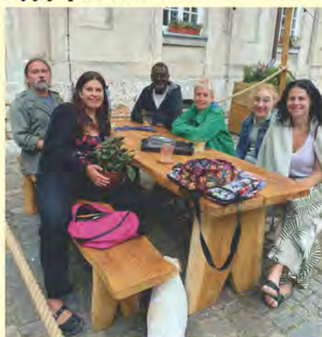
Z świdwińskimi przyjaciółmi na zamkowym dziedzińcu

Mam nadzieję, że za rok, przy ognisku nad naszym Nielepem znowu posłuchamy jej opowieści.