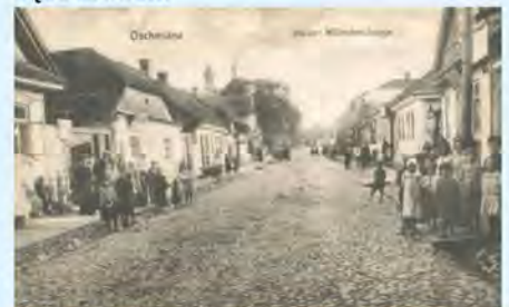
Ulica w starej Oszmianie

Ojciec jako uczestnik wojny w 1920 i 1939 roku po powrocie wraz z kilkoma kolegami z Zaleszczyk został za denuncjowany przez Białorusinów; wchodzą żołdaci ze szpicami na głowach, drzwi przycisnęli nogą, sztyki do piersi i „ruki wier!” Wziął trochę jedzenia i pociągami długim na 94 wagony z trzema lokomotywami, bez jedzenia, w mróz, dotarli do Gór Sajańskich, w autonomii chakańskiej, do kopalni złota, gdzie dzicz, szamani, baby w szerokaśnych spódnicach z cybuchami i warkoczykami – żywe wiedźmy. Duże baraki na 32 rodziny. Wysoko wiszące wózki transportowe wiozące urobek.