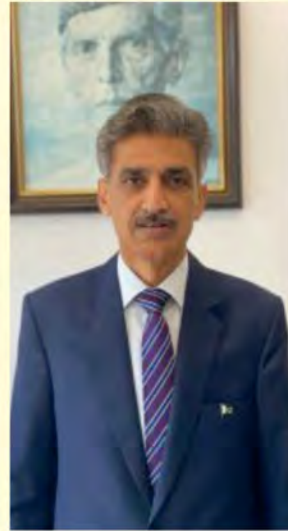
JE Malik Muhammad Farooq, ambasador Islamskiej Republiki Pakistanu w Polsce