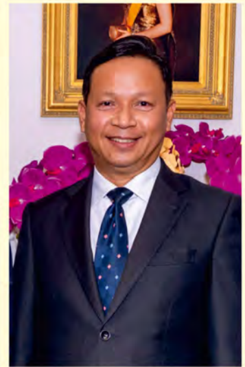
JE Chettaphan Maksamphan, ambasador Królestwa Tajlandii w Polsce