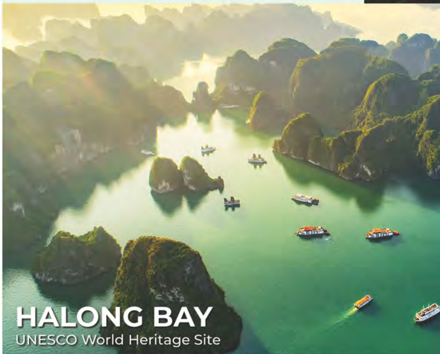
HALONG BAY UNESCO World Heritage Site

Wietnam, mający tropikalny klimat, jest dobrze znany ze wspaniałych krajobrazów i kolorowych plemion górskich, szerokich pól tarasowych w delcie rzeki Czerwonej i delcie rzeki Mekong, majestatycznych gór i białych piaszczystych plaż. Wietnam jest obecnie jednym z miejsc w Azji, których nie można przegapić. Legendy mówią, że większość mórz i krajobrazów w Wietnamie to perły wypływane przez Smoka wysłanego przez Wszechmocnego, aby pomóc Wietnamczykom w ich trudnej sytuacji i mogli pozostać „Wietnamczykami”. Odkrywczy i turyści nazywają je prawdziwymi cudami świata. Przykładem jest Zatoka Lądującego Smoka (Ha Long), leżąca na północno-wschodnim wybrzeżu, jest jednym z takich arcydzieł natury.