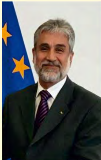
JE Mahmoud Khalifa, ambasador Państwa Palestyny w Polsce