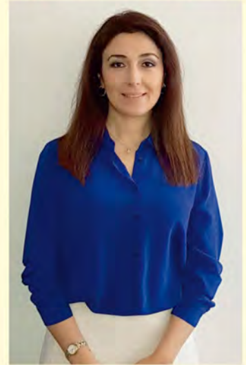
JE Nargiz Gurbanova, ambasador Republiki Azerbejdżanu w Polsce