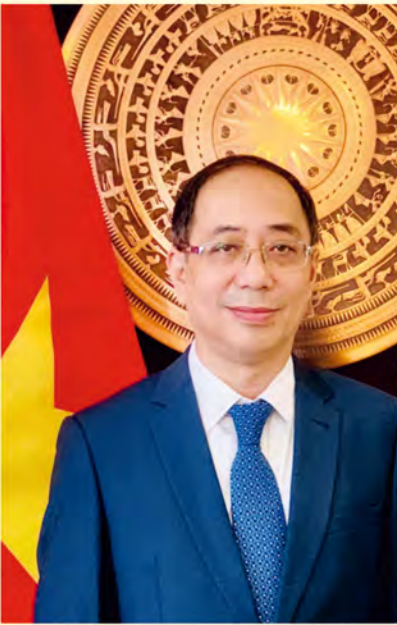
JE Nguyen Hung, ambasador Socjalistycznej Republiki Wietnamu w Polsce