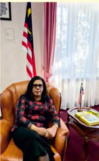
JE Chitra Devi Ramiah, ambasador Malezji w Polsce