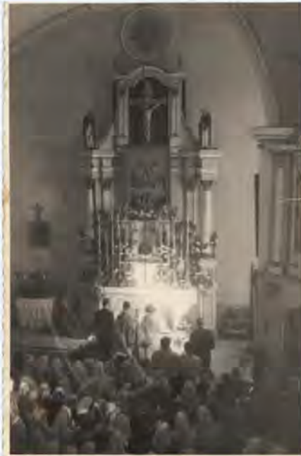
Wnętrze kościoła w Krotoszynie