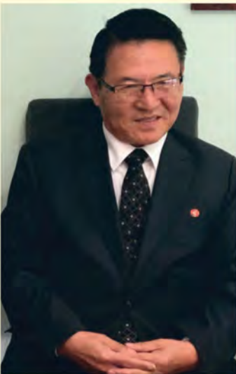
JE Choe IL, ambasador Koreańskiej Republiki Ludowo-Demokratycznej w Polsce