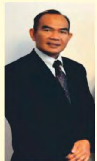
JE Taufiq Lamsuhur, chargé d'affaires a.i. Ambasady Republiki Indonezji w Polsce