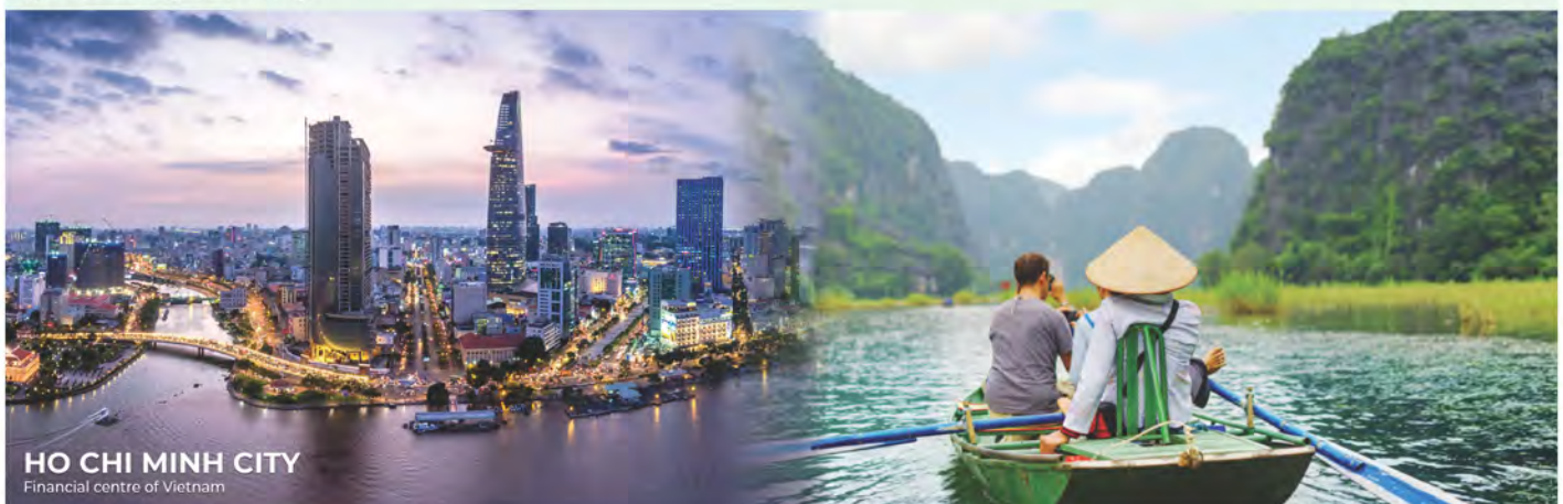
HO CHI MINH CITY Financial centre of Vietnam

Kolejną specjalnością Wietnamu jest bogactwo jego kultury. Ten odcinek ziemi w kształcie litery S na wschodnim krańcu Półwyspu Indochińskiego jest zamieszkiwany przez 54 grupy etniczne o tuzi tradycyjných kulturach, z których każda jest tak oryginalna jak sam kraj. Można powiedzieć, że w historii Wietnamu nakładały się na siebie trzy warstwy kultury: kultura lokalna, kultura mieszająca się z kulturą Chin i innych krajów regionu oraz kultura, która wchodziła w interakcje z kulturą zachodnią. Najważniejszą cechą kultury wietnamskiej jest to, że nie została zasymilowana przez obce kultury dzięki silnym lokalnym fundamentom kulturowym. Wręcz przeciwnie, Wietnam był w stanie wykorzystać i zlokalizować tych z zagranicy, aby wzbogacić kulturę narodową.