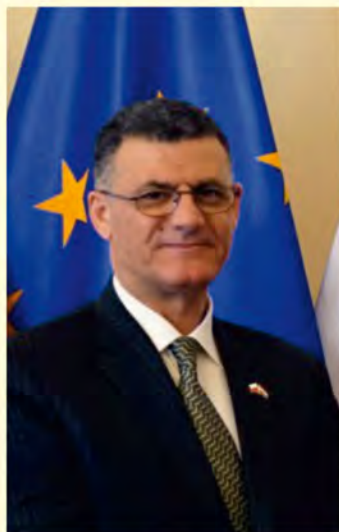
JE Hussein al-Safi, chargé d'affaires a.i. Ambasady Iraku w Polsce