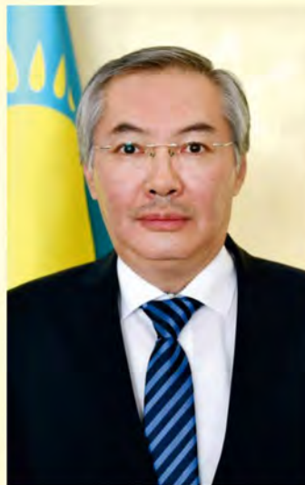
JE Alim Kirbayew, ambasador Republiki Kazachstanu w Polsce