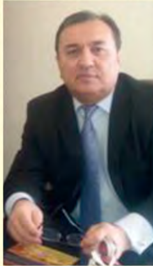
JE Bakhrom Babaev, ambasador Republiki Uzbekistanu w Polsce