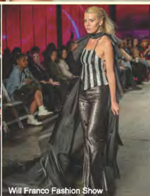
Will Franco Fashion Show