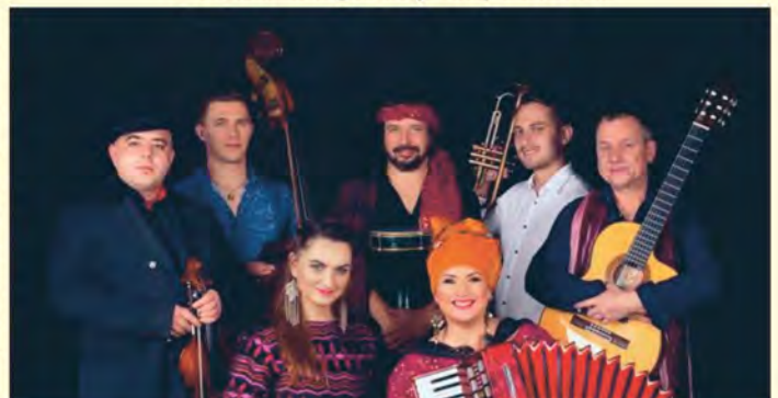
Występ zespołu „Dikanda”