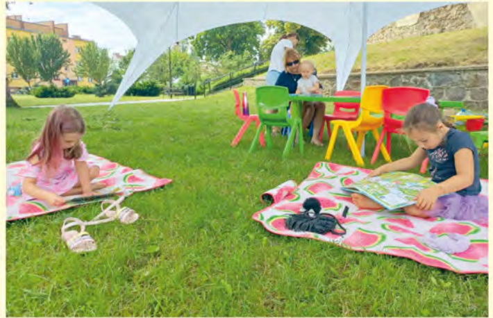
Czytanie na trawie na podzamczu