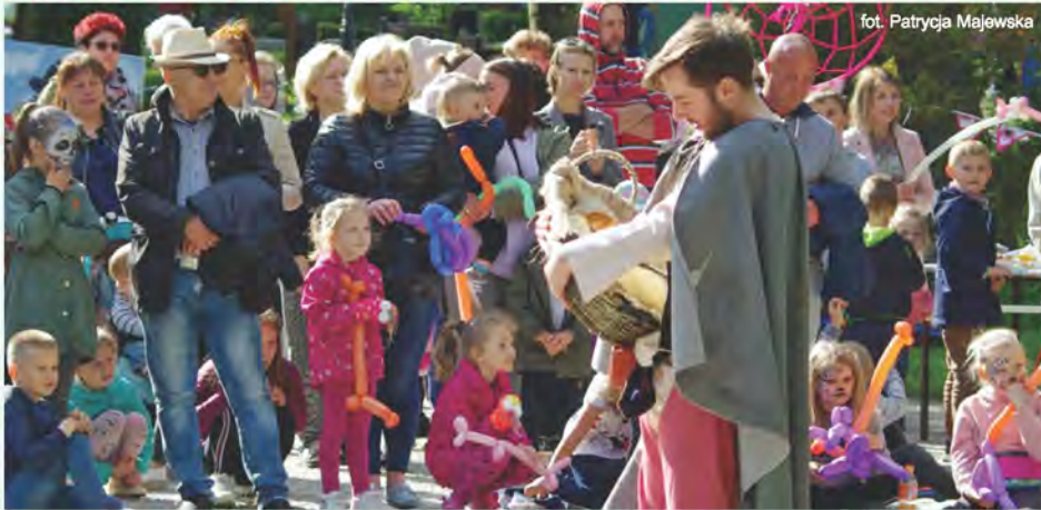
UM, fot. Patrycja Majewska

Z okazji Dnia Dziecka w połczyńskim Parku Zdrojowym Miejskie Centrum Kultury zorganizowało festyn. Mobilne Centrum Kultury prowadziło ciekawe gry, zabawy oraz konkursy. Dzieci mogły uczestniczyć w warsztatach plastycznych pod nazwą „Kreatywne lektury” i wykonać wspólnie z instruktorką ciekawe postaci z bajek. Mali uczestnicy festynu chętnie odwiedzali także stoisko z balonami, brokatowymi tatuażami i malowaniem twarzy. Nie zabrakło również baniek mydlanych oraz wspólnych tańców. W ramach festynu prowadzone były także warsztaty gry na brazylijskich bębnach „Samby batucady”, których uczestnicy przygotowywali się do wspólnego występu 3 lipca z okazji otwarcia Magicznej Ulicy Parasoli. Festyn zakończył się klimatycznym spektaklem w wykonaniu Teatru Tęcza ze Słupska, pt. „O trzech zaklętych królewnach, czyli opowieści rozbójników”.