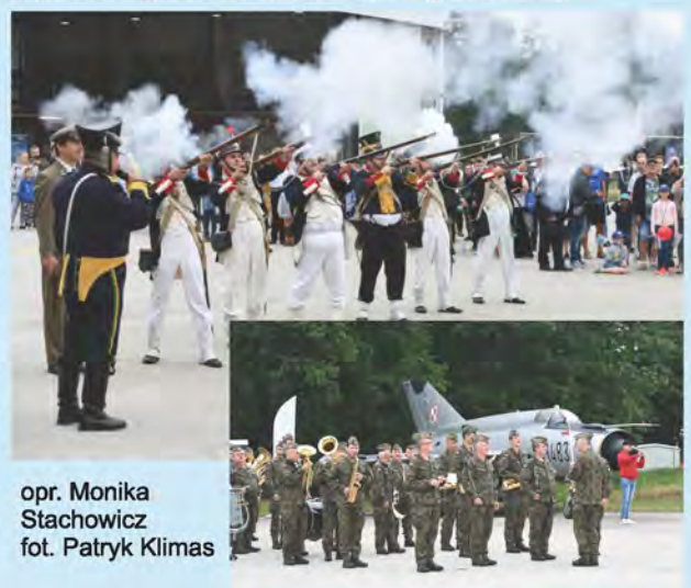
opr. Monika Stachowicz

raketowy POPRAD, 36. dywizjon raketowy OP zaprezentował wyrzutnię rakiet W-125SC, stację naprowadzania rakiet SNR-125SC, armatę plot. ZU-23-2, 22. Baza Lotnictwa Taktycznego zaprezentowała samolot MIG-29, robot saperski Expert, kombinezon przeciwwybuchowy EOD-9, trał BOŻENA, 12. Baza Bezzałogowych Statków Powietrznych zaprezentowała bezzałogowy statek powietrzny Orbiter, 142. batalion lekkiej piechoty WOT wystawił stanowisko promocyjne, firma Lockheed Martin zaprezentowała makietę samolotu F-35, Grupa Rekonstrukcyjno-Historyczna z Klubu Wojskowego 7. Brygady Obrony Wybrzeża zaprezentowała pokaz historycznych ubiorów militarnych oraz pokaz broni historycznej, Świdwińskie Stowarzyszenie Lotnictwa Rekreacyjnego zaprezentowało sprzęt paralotniowy oraz modele statków powietrznych. Podczas pikniku działał również Mobilny Punkt Szczepień oraz Mobilny Punkt Poboru Krwi. Swoje stoiska promocyjne wystawiły m.in. Policja, Nadleśnictwo, ITWL, Northrop Grumman i wiele innych firm. Dowódca 21. Bazy Lotnictwa Taktycznego płk. pil. mgr inż. Bartłomiej Mejka serdecznie dziękuje za przybycie oraz udział w Pikniku, a szczególnie podziękowania składa Stowarzyszeniu Miłośników Lotniska Wojskowego Świdwin oraz jego prezesowi płk rez. Mariuszowi Lipińskiemu .