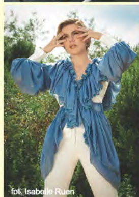
fot. Isabelle Ruen