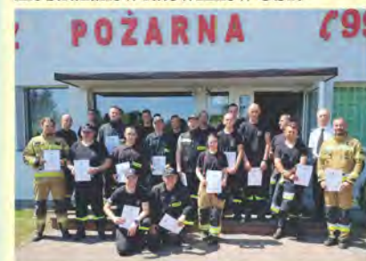
Uczestnicy szkolenia z dyplomami.

Funkcjonariusze świdwińskiej PSP w współpracy z Nadleśnictwem Świdwin oraz KP Policji przeprowadzili szkolenie strażaków ratowników OSP.