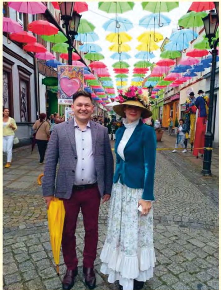
Otwarcie Magicznej Ulicy Parasoli