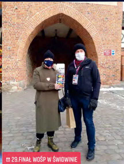
29.FINAŁ WOŚP W ŚWIDWINIE