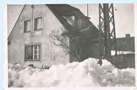
Bywały niegdyś zimy. Rodzice w oknie naszego domku