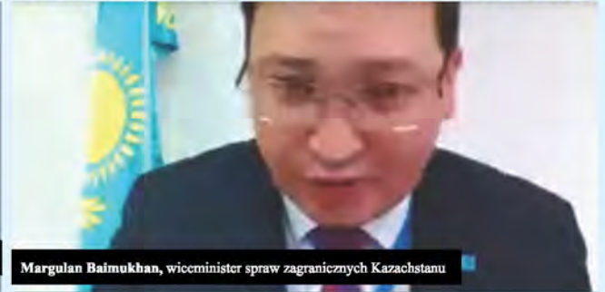
Margulan Baimukhan, wiceminister spraw zagranicznych Kazachstanu