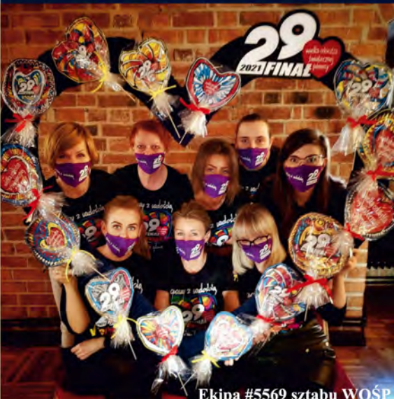
Ekipa #5569 sztabu WOŚP