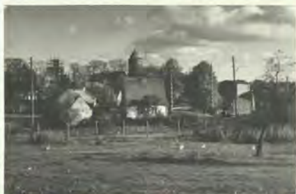
Nasz dom od ul. Pocztowej

Był zawsze, dokąd sięgam pamięcią. Drewniany, solidny, rozsuwany. Stał w dużym – stołowym pokoju. Dzisiaj nowoczesnie i po pańsku w wielu domach nazywany salonem. Bardzo mnie to bawi. Przy nim w święta i rodzinne uroczystości siadała nasza liczna rodzina: przyjęcie weselne najstarszej siostry, prymicyjne brata, ba, nawet czuwanie po śmierci ojca, gdy stół odpowiednio nakryty stawał się katafalkiem. Służył starszym braciom, później nam młodszym jako stół pingpongowy. Na nim leżały tusze świniaka ubitego na święta, bo pokój był zimny, opalany tylko na Boże Narodzenie.