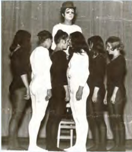
Teatr Kontrasty, lata 60. Byłem jedynym chłopakiem w zespole.