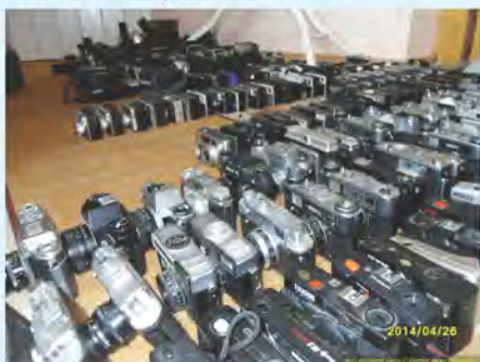
Fragment zbioru aparatów fotograficznych.