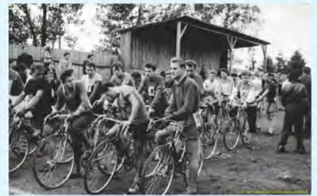
Świdwin przed laty słynął z wielu dyscyplin sportowych, również z kolarstwa. Cykliści przed trybuną honorową na naszym stadionie.

Pracował w wielu urzędach i zakładach, ale zawsze zawodowo i społecznie zajmował się fotografią i filmowaniem. Między innymi jako szef rąbińskiego, później świdwińskiego gminnego ośrodka kultury, prowadzi klub fotograficzny i filmowy w świdwińskim powiatowym domu kultury.