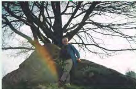
Głaz w Kłodzinie

Wiosną, po 55 latach pracy (złośliwi twierdzą, że zatrudnienia), mam nareszcie tyle czasu, aby poświęcić się ulubionym zainteresowaniom. Oprócz przygotowania tekstów do drugiej książki o świdwińskich historiach i wyszukiwaniu nowych tematów, tym zajęciem jest łązenie po okolicznych lasach. Nie tylko za grzybami. Podziwiam starodrzewy. Pstrykam w telefonie endomondo i mogę wędrować bez obawy, że pobłądzą. Robię po kilka, czasami kilkanaście kilometrów.