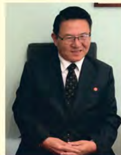
JE Choe II, Ambasador Koreańskiej Republiki Ludowo-Demokratycznej w Polsce