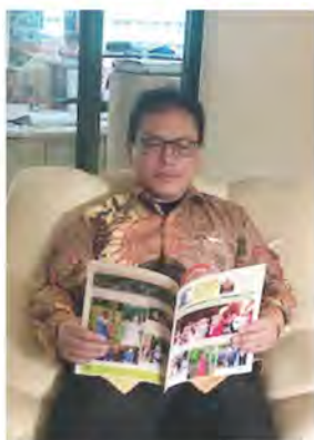
Basana Mangihuttua Sidabutar, Radca Minister Ambasady Indonezji