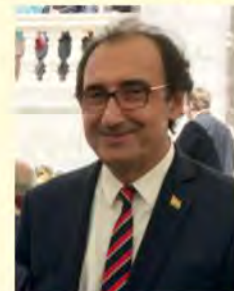
JE Ziyad Raof, Pelnomocnik Rządu Regionalnego Kurdystanu w Polsce