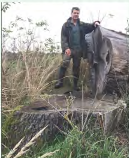
Tyle zostało po dębach

Wiosną, po 55 latach pracy (złośliwi twierdzą, że zatrudnienia), mam nareszcie tyle czasu, aby poświęcić się ulubionym zainteresowaniom. Oprócz przygotowania tekstów do drugiej książki o świdwińskich historiach i wyszukiwaniu nowych tematów, tym zajęciem jest łązenie po okolicznych lasach. Nie tylko za grzybami. Podziwiam starodrzewy. Pstrykam w telefonie endomondo i mogę wędrować bez obawy, że pobłądzą. Robię po kilka, czasami kilkanaście kilometrów.