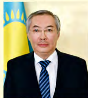
JE Alim Kirbayew, Ambasador Republiki Kazachstanu w Polsce