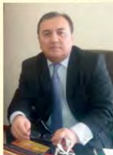
JE Bakhrom Babaev, Ambasador Republiki Uzbekistanu w Polsce