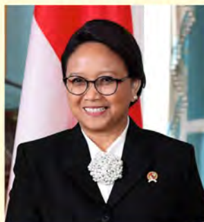
JE Retno Lestari Priansari Marsudi, Minister Spraw Zagranicznych Republiki Indonezji