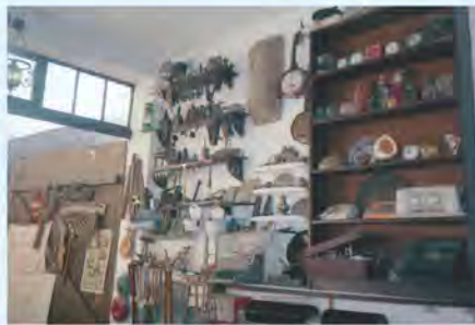
Część kolekcji sprzętu domowego.