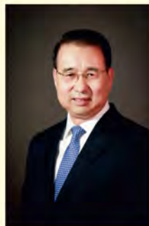
JE Liu Guangyuan, Ambasador Chińskiej Republiki Ludowej w Polsce