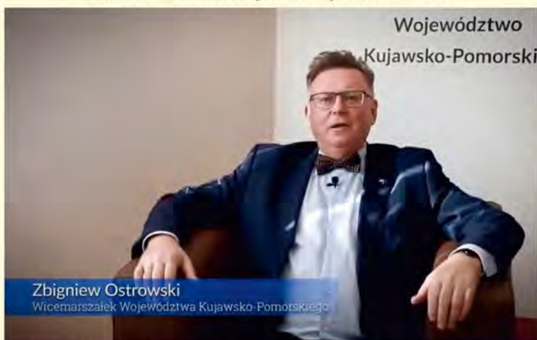
Zbigniew Ostrowski , Wicemarszałek Województwa Kujawsko-Pomorskiego