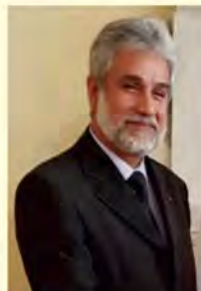
JE Mahmoud Khalifa, Ambasador Państwa Palestyny w Polsce