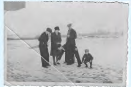
Z rodzicami na łodzie.