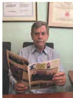
dr Krzysztof Janik , były minister spraw wewnętrznych, Akademia Krakowska