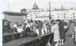
Targowisko przy ul. Sportowej