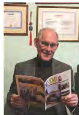
Robert Kwiatkowski, poseł na Sejm RP