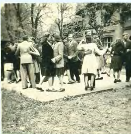
Zabawa w Dużym Parku

Pracowałam najpierw w sklepie wazynnym – były tam jeszcze Niemki – a polityka władz była taka, aby do każdej instytucji, do każdego miejsca pracy stopniowo wprowadzać Polaków. Później pracę przerwałam ze względu na dzieci, a ponadto zaczęły się między ludźmi kształtować stosunki, nawiązywać znajomości, zanikało powoli uczucie obcości. A w ogóle to panowała wówczas dość wesoła atmosfera, organizowano zabawy ludowe, festyny. Ludzie lubili się bawić.