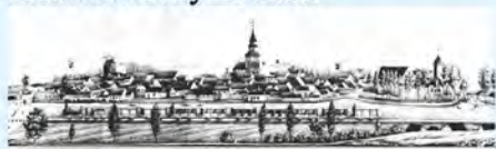
Świdwin około 1860 r.

Zdjęcia pochodzą ze zbiorów Stowarzyszenia Carpe Diem, zrobione w latach 40. i 50. na boisku „Jedynki” oraz zabawa w Dużym Parku.