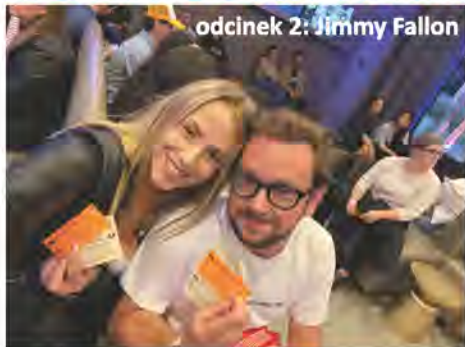
odcinek 2: Jimmy Fallon

Od najmłodszych lat z niecierpliwością czekałem na kolejny odcinek amerykańskiego programu „The Tonight Show”. To codzienny, nadawany od 1954 roku, najślynniejszy w Stanach Zjednoczonych talk-show, w którym prowadzący najpierw wygłasza zabawny monolog, będący komentarzem bieżących spraw, a następnie rozmawia z zaproszonymi gośćmi. Zasada jest prosta; początkowym rozmówcą jest gwiazda z pierwszych stron gazet, następnie ktoś mniej znany, ale oczywiście wciąż bardzo popularny. Koniec programu, to zawsze ciekawostka; występ muzyczny, artystyczny lub komediowy akt jakiegoś początkującego stand-upera .