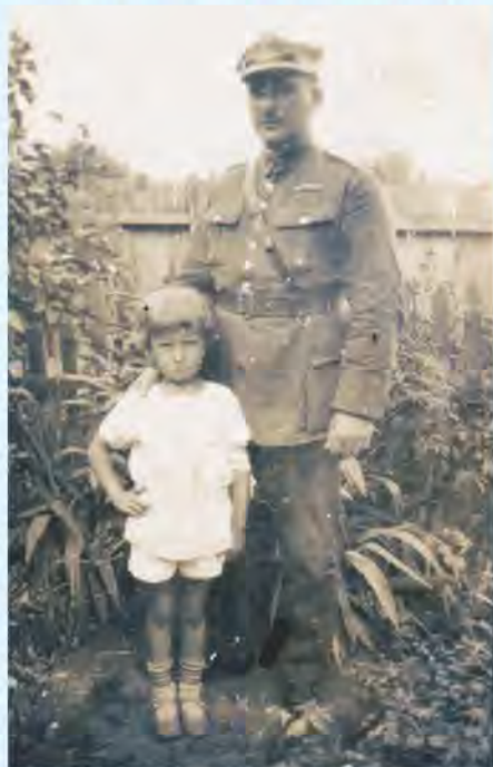
Autor wspomnień z ojcem

Wiele już razy przystępowałem do spisania wspomnień (...) ale ciągle brakowało czasu. Teraz na emeryturze, postaram się opisać dzieje moje i mojej rodziny.