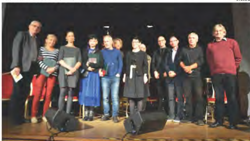
Pamiętkowa fotografia laureatów i jurorów.