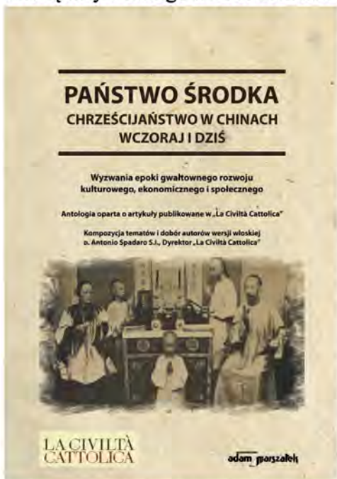
Państwo Środka. Chrześcijaństwo w Chinach wczoraj i dziś , Wydawnictwo Adam Marszałek, Toruń 2019, ss. 421