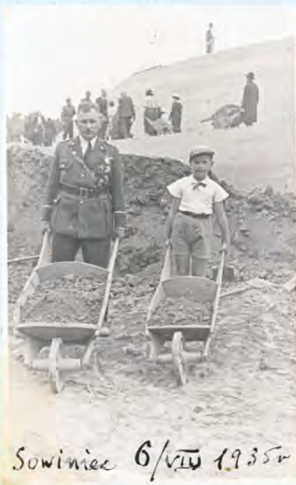
Sowiniec 6/VII 1935r