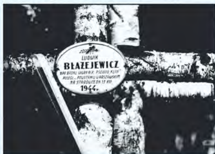
Mogiła ojca w kwaterze powstańczej na warszawskich Powązkach. Na tabliczce błąd w nazwisku.

Nie miała kontaktu z ojcem. Po ponad rocznym pobycie na robotach wróciła do kraju. Pracowała w Polskim Czerwonym Krzyżu. Identyfikowała z innymi zwłoki powstańców. Bolesnie przeżyła dzień, kiedy wśród poległych rozpoznała ciało ojca. Spoczął w kwaterze powstańczej na Powązkach, pod prostym brzoźowym krzyżem. Kapral Ludwik Błazewicz.