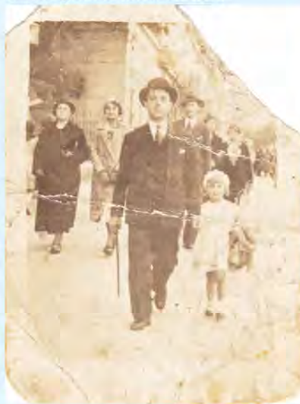
Z ojcem w Alejach Ujazdowskich, 1932 rok.