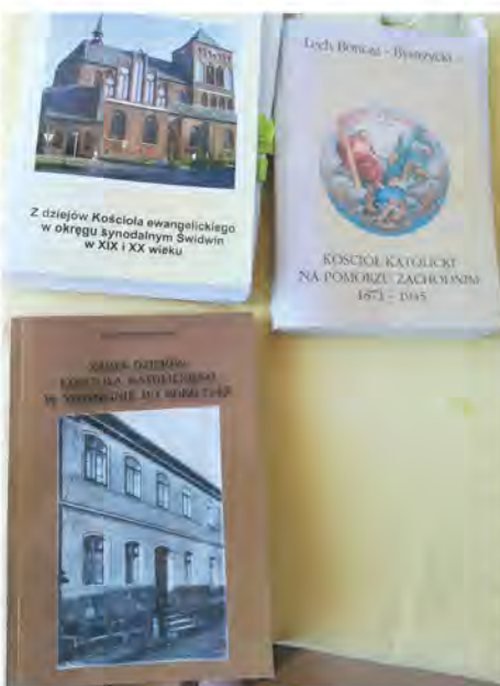
Ostatnie publikacje ks. profesora