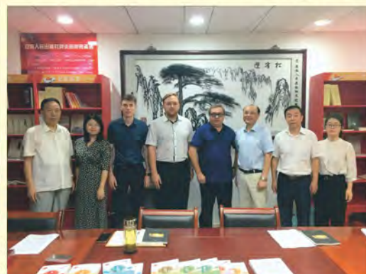
B.P. Anhui People's Publishing House