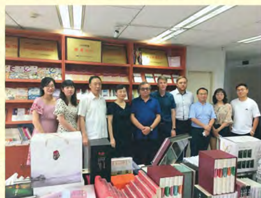
Anhui Literature and Art Publishing House