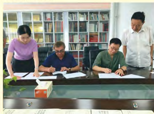
Time Publishing & Media

Bardzo owocny był pobyt w Hefei delegacji Marszałek Publishing Group. W trakcie jego trwania podpisano z czterema czołowymi wydawnictwami Anhui Publishing Group kilkanaście umów przewidujących opublikowanie w Polsce kilkudziesięciu książek prezentujących historię, kulturę oraz współczesność Chin.