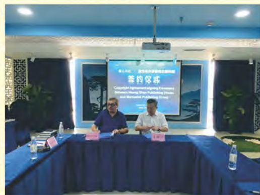
Huang Shan Publishing House