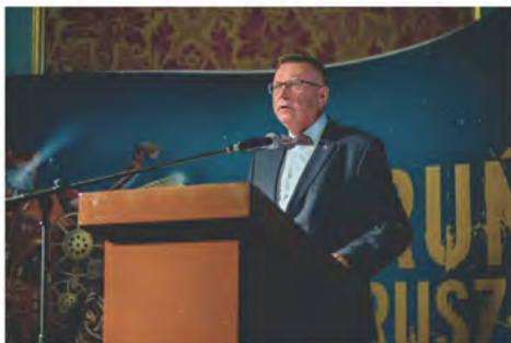
Wicemarszałek Zbigniew Ostrowski