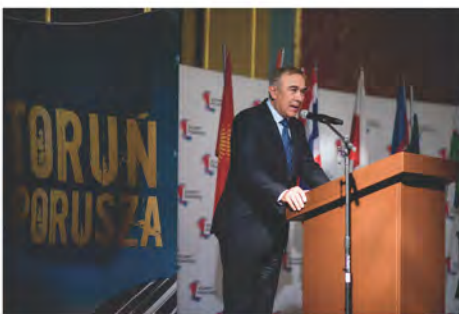
Senator Grzegorz Czelej