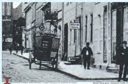
Hotel Iben przy dzisiejszej 1 Maja

Przyjeżdżający do miasta koleją w sprawach służbowych lub we własnym interesie udawał się do hotelu, gdzie mieszkał i jadał. Na ogół mocno pito i dobrze jedzono. Przeciwnicy alkoholu i wegetarianie traktowani byli lekceważąco. Podróżujący często mieli przy sobie wielkie kufry i walizy z naklejkami różnych hoteli. Ładowano je na omnibusy, które podjeżdżały do każdego pociągu. W razie potrzeby olbrzymie bagaże przewoził później wynajęty wozak lub służba właścicieli sklepów, z którymi podróżny robił interesy.