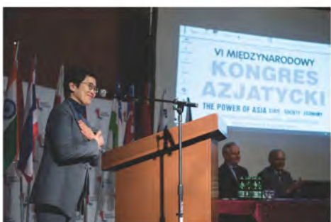
JE Mira Sun, ambasador Republiki Korei