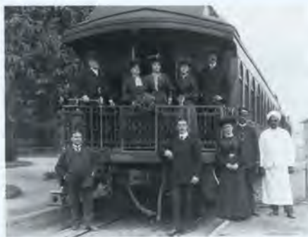
Adelina Patti (z kwiatami) w otoczeniu służby

wój występ. Mieszkańcy Świdwina nie sprostali zbyt wygórowanym ambicjom kulturalnym mojego szefa, sprzedano zbyt mało biletów. Pobrane pieniądze oddano wpłacającym.