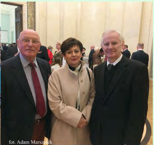
fot. Adam Marszałek