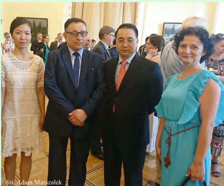
fot. Adam Marszałek