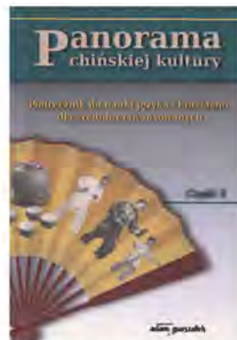
Panorama chińskiej kultury. Podręcznik do nauki języka chińskiego dla średniozaawansowanych. Część 1, ss. 235, Część 2, ss. 259, Wydawnictwo Adam Marszałek