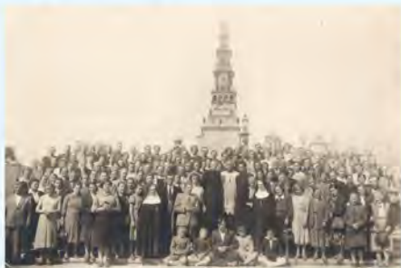
Pielgrzymka świdwińskich parafian do Częstochowy.