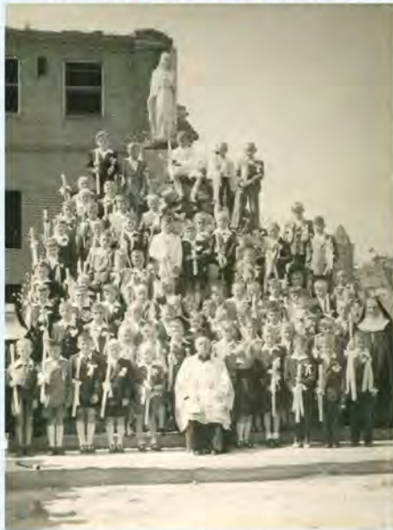
Przy grocie, koniec lat 40.