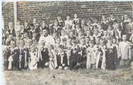
Zdjęcie pierwszokomunijne, początek lat 50. Jestem na samej górze, w środku (z loczkiem).

W miejscowości, w której był wikarym, prowadził pogrzeb. W pewnej chwili podszedł do niego miejscowy Ukrainiec i ostrzegł, że nacjonałiści chcą go zamordować i musi natychmiast uciekać. To wydarzenie mocno zaważyło na jego losie. Tak jak stał, w sutannie i komży, opuścił kondukt i ukrywał się aż do czasu przedostania się na Ziemię Odzyskaną.