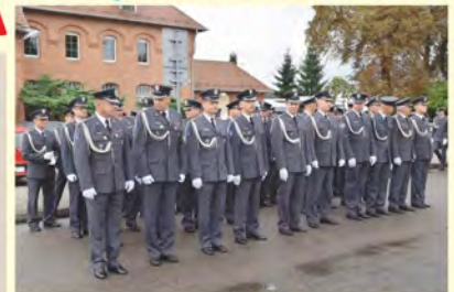
Uroczysta zbiórka pod pomnikiem. SZKOLNE INAUGURACJE