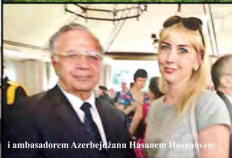
i ambasadorem Azerbejdżanu Hasanem Hasanovem