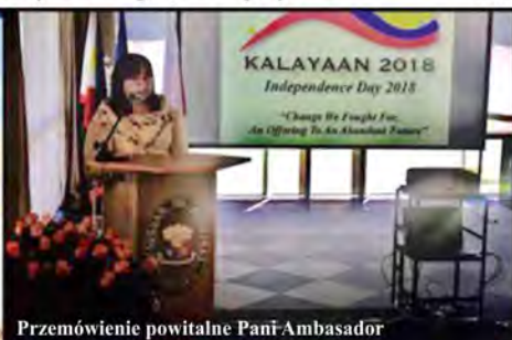
Przemówienie powitalne Pani Ambasador