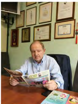
prof. zw. dr hab. Tadeusz Iwiński , Wyższa Szkoła Bezpieczeństwa, Poznań