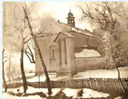
Kościół w przedwojennym Krotoszynie