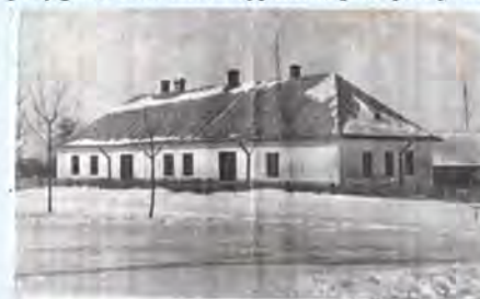
Szkoła w przedwojennym Krotoszynie

Już wczesną wiosną wyjeżdżali pierwsi odważni, między innymi ksiądz. Z początkiem kwietnia przywożą przesiedlonych z Sanu Ukraińców, którzy mieszkają razem z nami i czekają na nasz wyjazd, spędzają z nami święta Wielkanocne. Są nie mniej zastraszeni od nas. Po świętach przygotowania do wyjazdu, pakujemy co