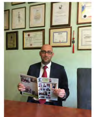
Zbigniew Rasielski , wiceprezydent Torunia