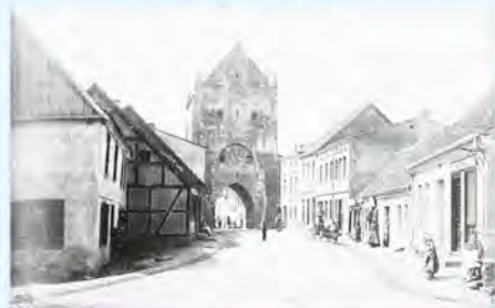
Widok na Bramę Kamienną od strony placu Jana Pawła II

Świdwin był przecież po części miastem rolniczym. Wystarczy popatrzeć na nazwy ulic [m.in. Młyńska, Końska, Myśliwska, Górzysta, Stodołowa, Ogrodowa, Kwiatowa, Pasterska Droga – Z.C.].