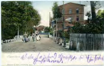
Ulica Nowomiejska (Neustadstrasse)