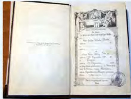
Niemiecki modlitewnik, który zawierał teksty modlitw, fragmenty Pisma Świętego i Psalmi

dyżurnego ruchu, obsługiwał kasę. Opiswane wydarzenia obejmują okres od marca do listopada 1945 roku, a ukazały się w: „Die Pommersche Zeitung” (Gazeta Pomorska) pod tytułem I dwunastolatnie dziewczęta musiały znosić to cierpienie .