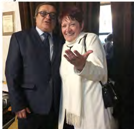
Adam Marszałek i Joanna Rawik