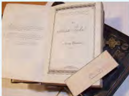
Modlitewniki były również kroniką rodzinną, w której odnotowywano ważne wydarzenia: narodziny, konfirmacje, śluby i zgony (1943 i 1944 r.)