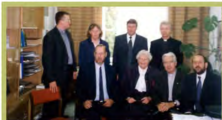
Zaproszeni goście przed uroczystościami na kirkucie.