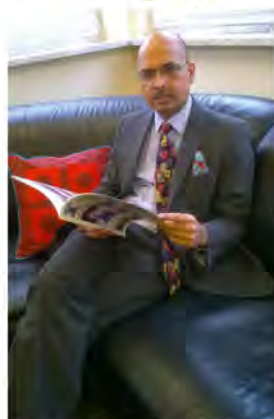
JE Mahfuzur Rahman ambasador Bangladeszu