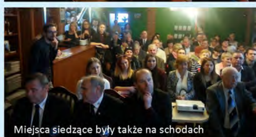
Miejsca siedzące były także na schodach