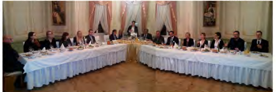
Ożywiona dyskusja trwała także w trakcie uroczystej kolacji