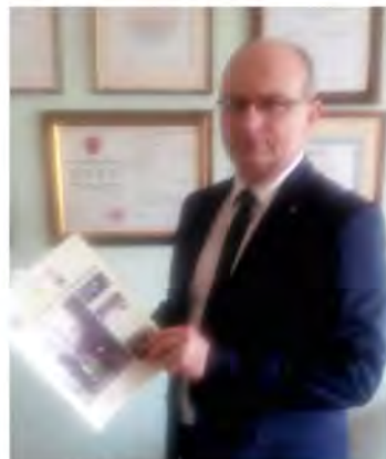
Mirosław Graczyk starosta toruński