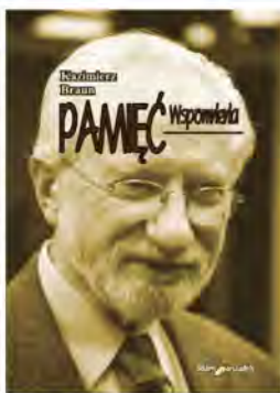
K. Braun, Pamięć. Wspomnienia , Wydawnictwo Adam Marszałek, Toruń 2015, ss. 499.