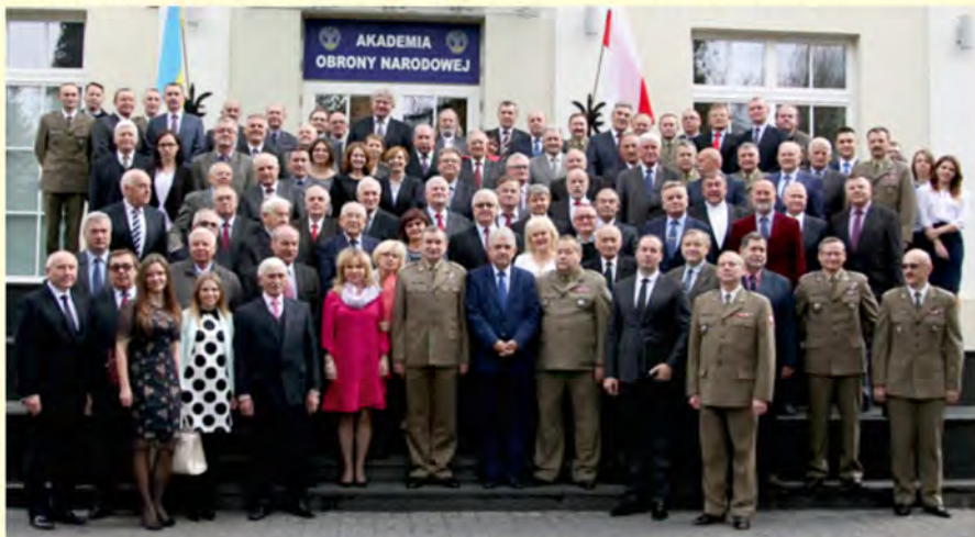
Wspólna fotografia uczestników imprezy jubileuszowej.