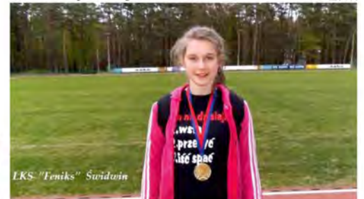
LKS „Feniks” Świdwin