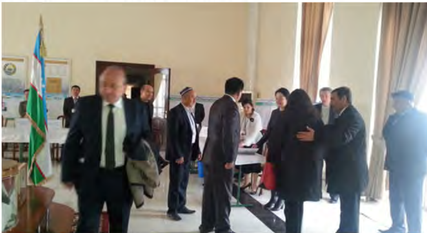
Obserwatorzy w lokalu wyborczym.