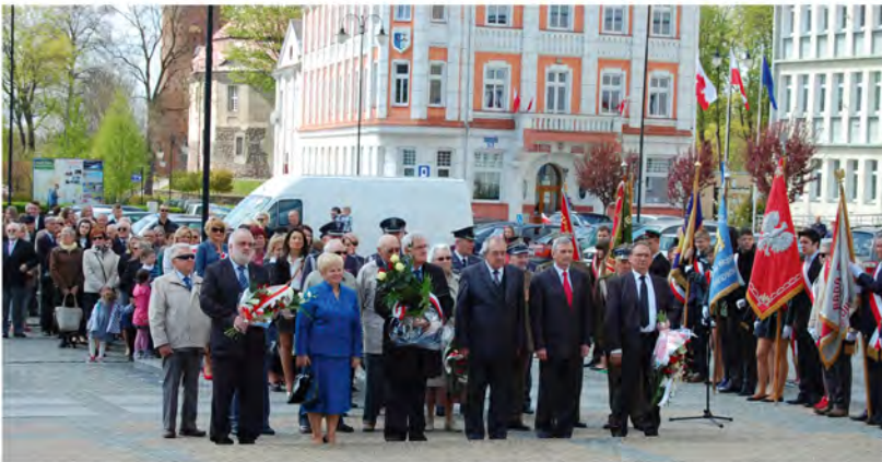
Przedstawiciele władz miasta i powiatu