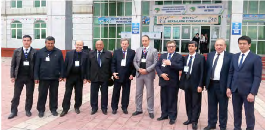
Polscy obserwatorzy odwiedzili punkty wyborcze w Taszkencie, Samarkandzie, Ferganie oraz w kilku mniejszych miejscowościach.