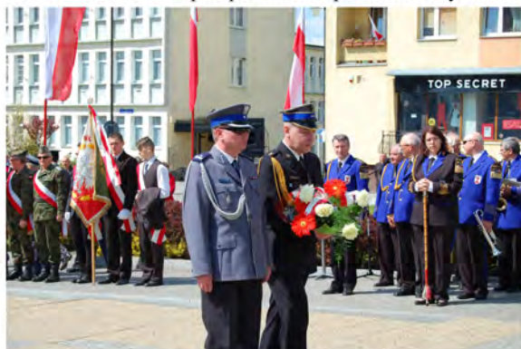
Kwiaty od policjantów i strażaków