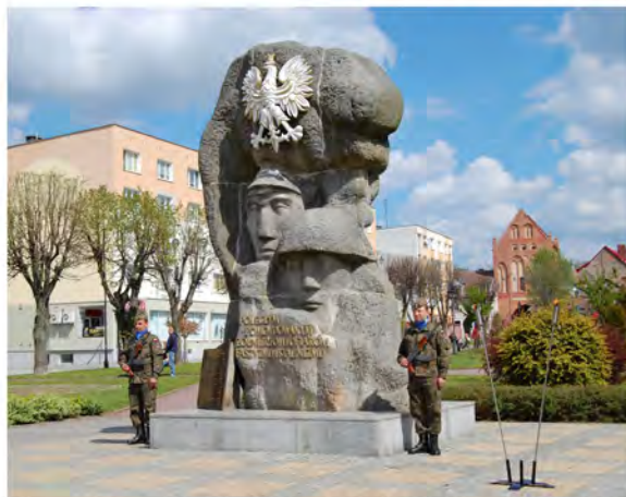
Warta honorowa pod pomnikiem pomordowanych