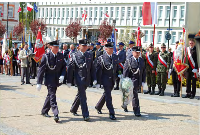
Reprezentacja świdwińskiego garnizonu