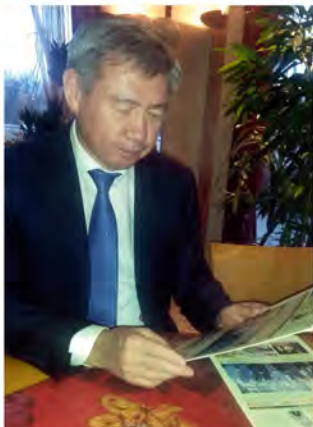
JE Yerik Utembayev , Ambasador Kazachstanu w Polsce