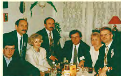
Grupa absolwentów rocznika 1971, zjazd w roku 1996