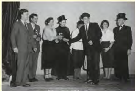
Wieczór poetycki poświęcony poecie Konstantemu Ildefonsowi Gałczyńskiemu (1958)