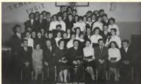
Uczestnicy studniówki rocznika 1959