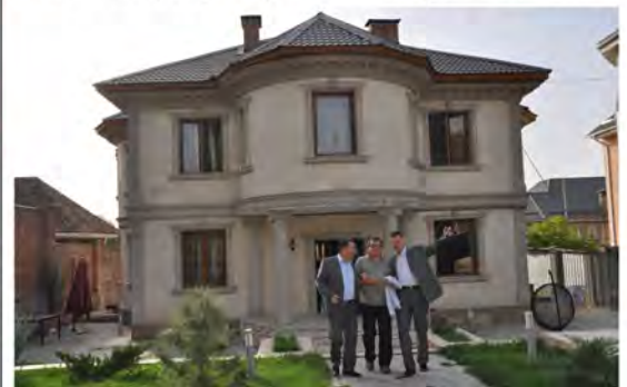
Pamiątkowa fotografia z Dziekanami przed rezydencją, w której mieszkała delegacja w czasie pobytu w Ałmacie.