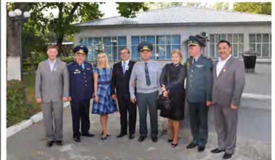
Spotkanie z władzami Uniwersytetu Wojskowego.