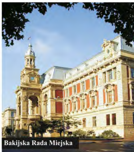
Bakijjska Rada Miejska

Zwieńczeniem kariery polskiego architekta Józefa Gosławskiego jest budynek Bakijjskiej Dumy (Rady Miejskiej). Gmach zajął dominującą pozycję w układzie urbanistycznym historycznej części miasta (powstał w latach 1899–1904). Zbudowany z zastosowaniem