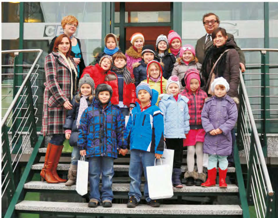
Nie obyło się oczywiście bez drobnych upominków i pamiątkowego zdjęcia.