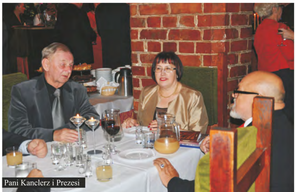
Pani Kanclerz i Prezesi