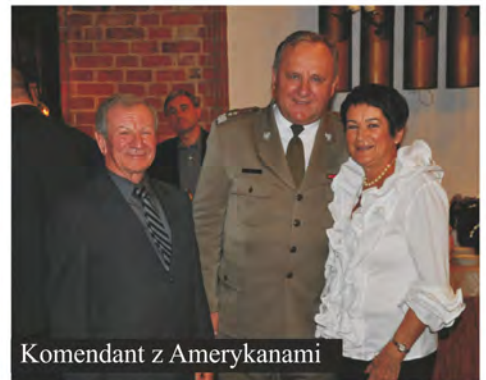
Komendant z Amerykanami