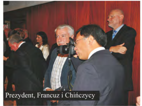
Prezydent, Francuz i Chińczycy