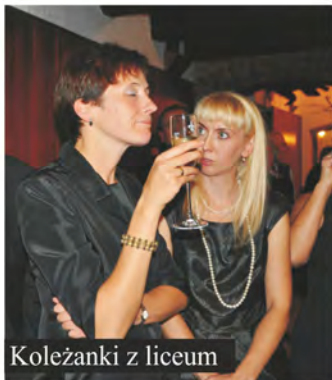
Koleżanki z liceum