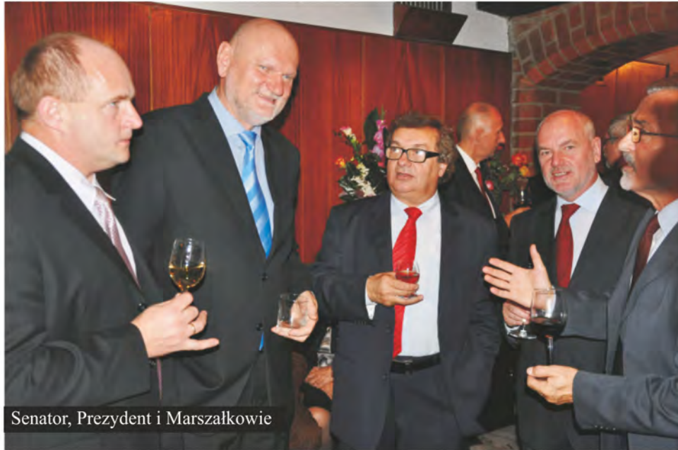
Senator, Prezydent i Marszałkowie