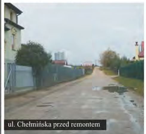
ul. Chelmińska przed remontem

Sukcesem zakończyły się starania Świdwina o kolejne fundusze zewnętrzne. W najbliższym czasie miasto otrzyma pieniądze na przebudowę drogi lokalnej oraz na zajęcia pozalekcyjne w szkołach. Już po raz czwarty samorząd uzyskał dotację z Narodowego Programu Przebudowy Dróg Lokalnych, popularnie zwanych „schetyńówkami”.