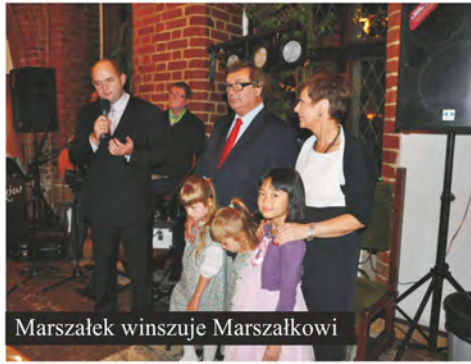
Marszałek winszuje Marszałkowi