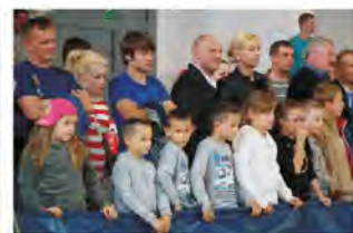
Zawodnicy i kibice w trakcie mistrzostw.