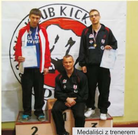
Medaliści z trenerem