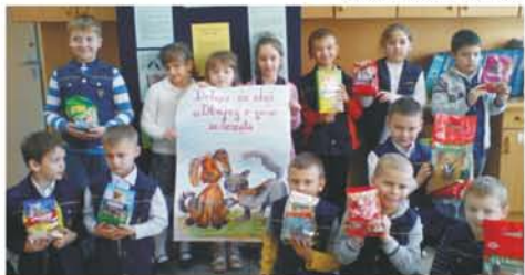
Dzieci z plakatem propagującym akcję.