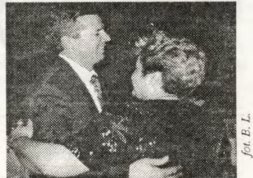
fol. B. L.

... a tak bawili się goście sylwestrowi w „Dwójce”