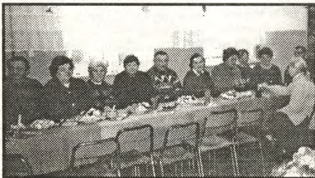
fol. M. K. Babcie i Dziadkowie w Dniu Swego Święta

cyjne „Sto lat” oraz wręczenie własnoręcznie wykonanych upominków. Były to laurki – serca i kwiaty z cukierków.