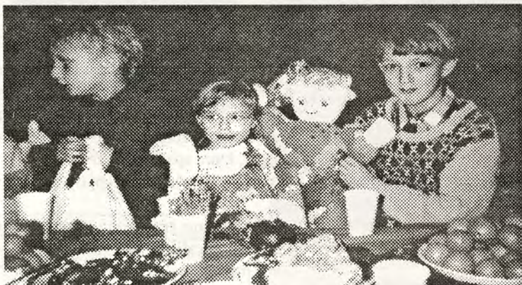
Wigilia zorganizowana przez Szkolne Koło PCK przy SP nr 1