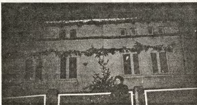
Posesja 3 Marca 25