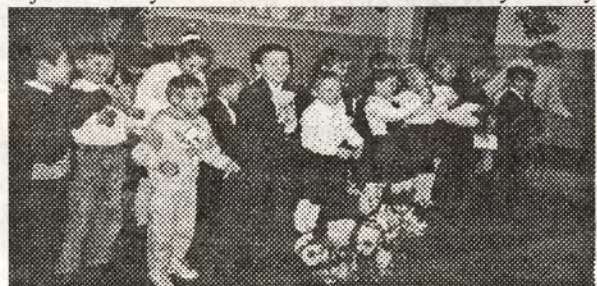
fol. M. K.

Imprezę tę przygotowali uczniowie z klasy „0”, I, II. Dzieci śpiewały piosenki i recytowały wiersze „O kochanej Babci i Najukochańszym Dziadku”. Na zakończenie było trady-