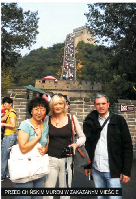
PRZED CHIŃSKIM MUREM W ZAKAZANYM MIEŚCIE