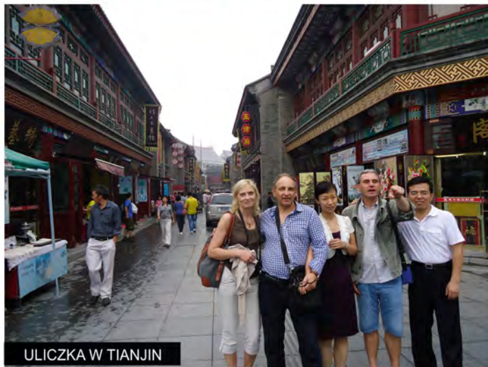
ULICZKA W TIANJIN

Rozwój gospodarczy Chin, postrzegany jako fenomen, staje się we współczesnej gospodarce światowej zjawiskiem coraz bardziej zbadanym i zwyczajnym. Otwieranie się Chin na świat z liberalizacją handlu i napływem bezpośrednich inwestycji zagranicznych, transferem innowacji i rozwojem działalności badawczo-rozwojowej zmienia wzorce konsumpcji i życie społeczeństwa chińskiego. Chińczycy się spieszą, ale też uśmiechają.