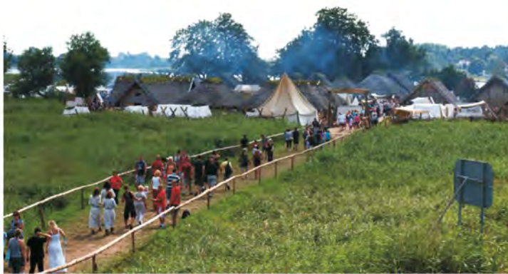
Tłumy podążały na wyspę specjalnie wytyczoną trasą.

W rozłożonych namiotach i straganach prezentowali zabytki sztuki czasów dawnych, powstające w ich warsztatach. Do Wolina przybyło blisko 60000 zwiedzających, którzy nie tylko odwiedzali wyspę Reclaw, na której znajduje się skansen i organizowany jest coroczny festiwal, ale także zaglądali do budynków Urzędu Miejskiego oraz Muzeum Okręgowego w Wolinie.