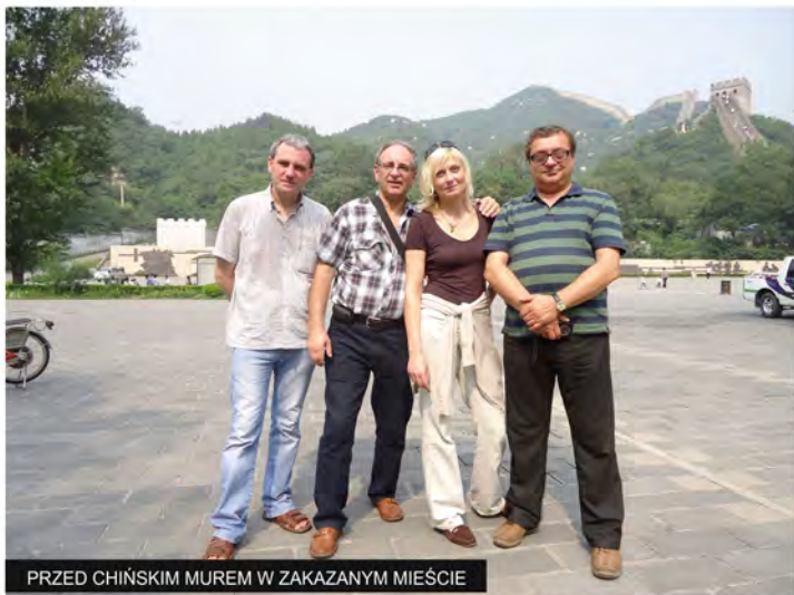
PRZED CHIŃSKIM MUREM W ZAKAZANYM MIEŚCIE

Rozwój gospodarczy Chin, postrzegany jako fenomen, staje się we współczesnej gospodarce światowej zjawiskiem coraz bardziej zbadanym i zwyczajnym. Otwieranie się Chin na świat z liberalizacją handlu i napływem bezpośrednich inwestycji zagranicznych, transferem innowacji i rozwojem działalności badawczo-rozwojowej zmienia wzorce konsumpcji i życie społeczeństwa chińskiego. Chińczycy się spieszą, ale też uśmiechają.