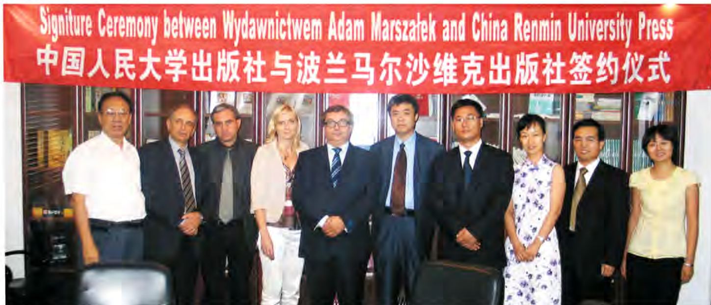
Pamiątkowa fotografia po podpisaniu umowy między Wydawnictwem Adam Marszałek i China Renmin University Press.