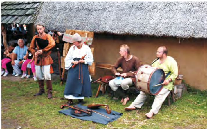
W trakcie Festiwalu występowało wiele zespołów prezentujących ubiór i instrumenty rodem ze średniowiecza.

Pomiędzy 5 a 7 sierpnia tego roku ponownie doszło do najazdu na Wolin. Jak co roku najechali go odtwórcy historyczni, by po raz kolejny spotkać się na udeptanym polu, pokazać jak ścierały się ze sobą zastępy wojów słowiańskich i Wikingów.