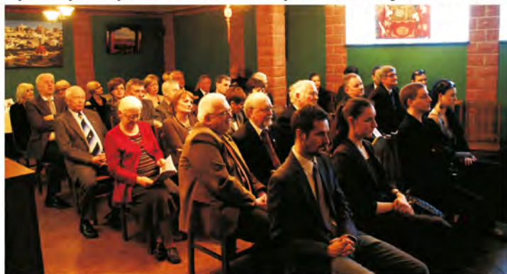
Zebrani goście z uwagą słuchali Pani Ambasadorki i zadawali pytania o trudne stosunki Polski z Litwą.