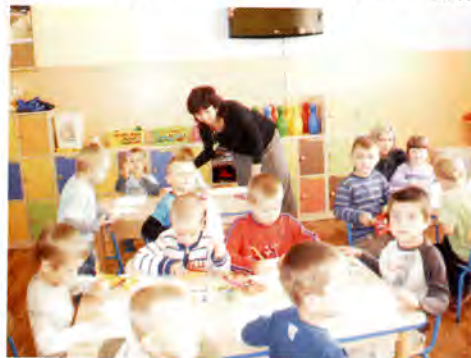
Dzieci w trakcie zajęć