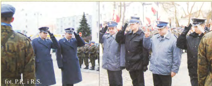
fol. P.R. i R.S.

Wczesnym popołudniem 3 marca 2010 r. 65 rocznicę wyzwolenia obchodził Świdwin. Mieszkańcy miasta i żołnierze uczestniczyli we mszy świętej za Ojczyznę w Kościele p.w. MBNP.