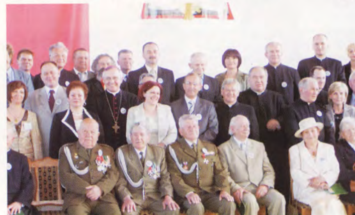
Pamiątkowe zdjęcie uczestników uroczystości